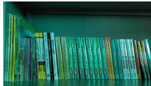
Gambar 3. Contoh Buku Bacaan