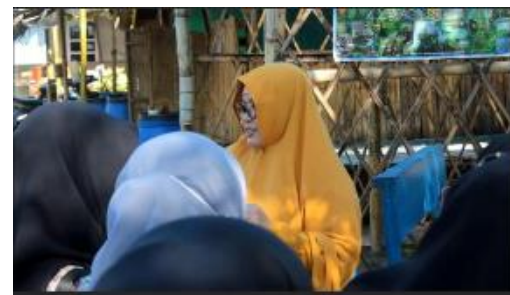
Gambar 5. Pembinaan Bahasa Inggris

Adapun respon yang ditunjukkan oleh masyarakat Desa