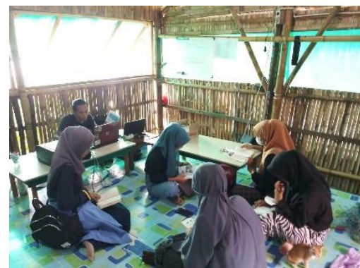
Gambar 4. Pengunjung Rumah Baca