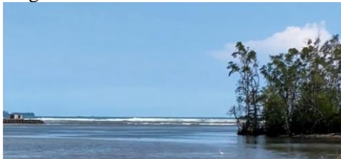
Gambar 1. Nuansa alam Desa Jenggalu

Kegiatan pembinaan literasi Bahasa Inggris untuk kelompok pemuda sadar wisata di Desa Jenggalu, Kota Bengkulu merupakan salah satu upaya edukasi Bahasa Inggris bagi masyarakat setempat. Kegiatan pembinaan berupa Rumah Baca yang diberi nama SALAM (Satu Asa dari Laut dan Alam Mangrove). Kata SALAM ini memiliki filosofi yang berkaitan erat dengan karakteristik Desa Jenggalu Kota Bengkulu yang berhadapan langsung dengan laut luas dan konservasi hutan Mangrove.