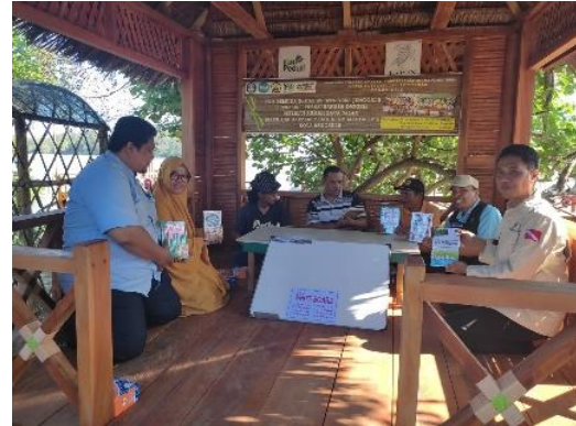
Gambar 2. Serah Terima Buku Bacaan

memanfaatkan semua buku ini dalam rangka untuk meningkatkan pengetahuan mereka bahasa Inggris dan hutan Mangrove.